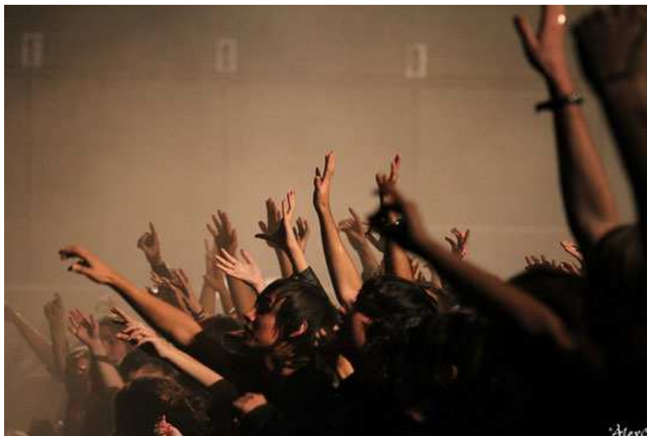
AVENGED SEVENFOLD + THE CANNIBAL QUEEN- BARCELONA. 20.10.2010